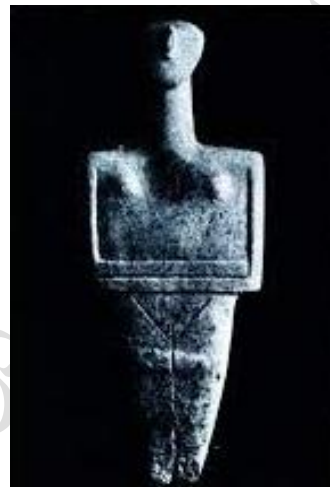
نمونه بت سیکلادی - مجسمه زن