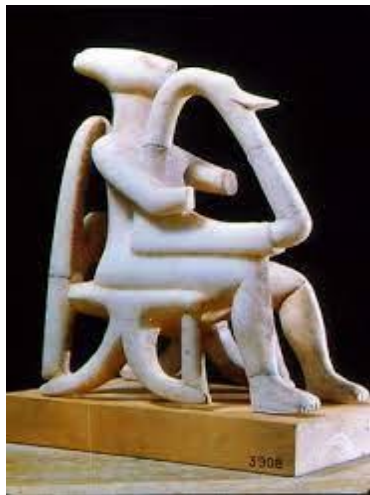
مجسمه چنگ نواز - مجسمه مرد

به اعتقاد باستان شناسان، پیکره چنگ نواز به پایان خط مربوط می شود و احتمالا با کاخ های کرتی همزمان بوده است.